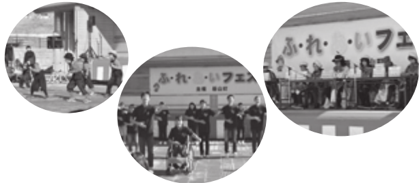
▲ 2016 ふ・れ・あ・いフェスタ ステージイベントのようす

まちづくり課 協働推進係 〒841-0204 基山町大字宮浦666 ☎92-7935 ✉ kyodosuishin-2@town.kiyama.lg.jp