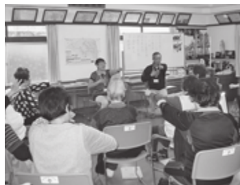
△サポーターさんの活動風景（10区公民館）