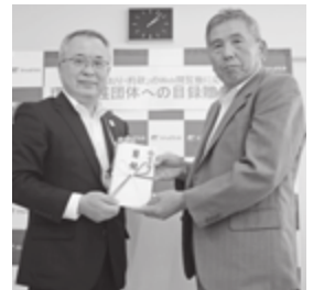
問合せ先 まちづくり課 協働推進係 ☎92-7935

かいろう基山は、園部地区の竹林伐採と竹の資源化に取り組み、森林環境の保全に長年尽力されている団体です。