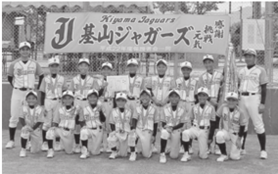
問合せ先 基山ジャガーズ ☎92-2317

7月8日(土)・17日(月)に行われた佐賀県少年野球選手権支部代表選考会において、基山ジャガーズが優勝しました。