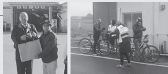
(左) 地元企業を訪問される様子 (右) 街頭でパンフレットを配布される様子

7区では、基山町まちづくり基金事業の支援を受け、地区内を通る外国人を対象とした4か国語対応の「多文化共生パンフレット」を作成されました。交通マナーや生活のルールなどが掲載されており、多文化共生に向けた生活支援活動として取り組まれています。このパンフレットは、地元企業や街頭で配布されています。