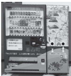
まちづくり支援自動販売機