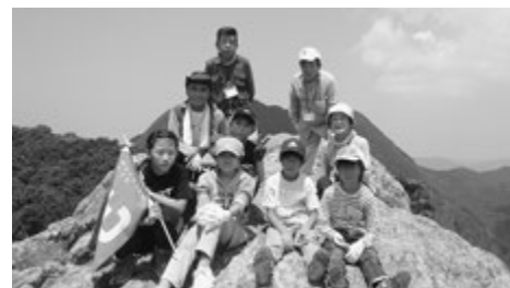
黒髪山頂上にて3班の子どもたち

8月10日(水)・11日(木)、基山町青少年育成町民会議夏期研修として、自然等体験登山が行われました。基山中学校、基山・若基小学校の子どもたち28名が参加し、武雄市の黒髪山(標高516m)に登りました。基肄山歩会の方々にご指導いただき、みんなで励まし合いながら、無事に登頂することができました。夜は、黒髪少年自然の家に宿泊し、ロープの結び方の講習を受けたり、レクリエーションで楽しい時間を過ごしたりしました。2日目は、武雄市の宇宙科学館でプラネタリウムや展示物などを見学しました。普段の生活では経験できない自然に触れ、貴重な体験をすることができました。