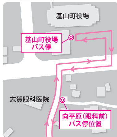
向平原(眼科前)バス停の設置場所