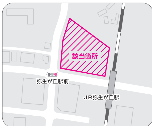
地区計画該当箇所