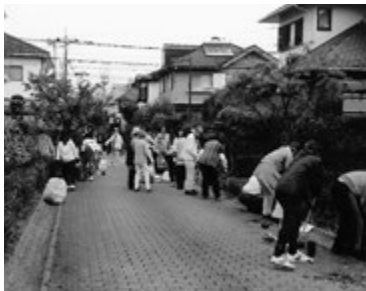
第17区自治会のコミュニティ道路内の花壇整備風景