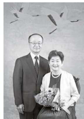
【ボランティア団体「すまいるフォト」による撮影作品例】