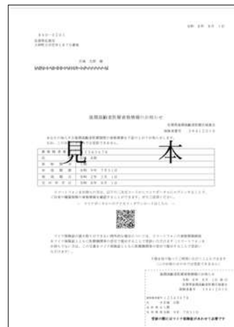
【資格情報のお知らせ】