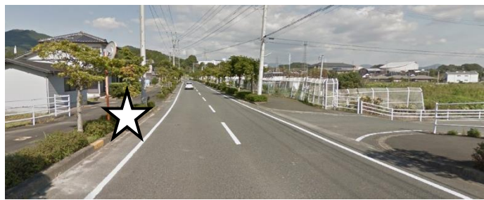
② 住吉 (塚原・長谷川線)