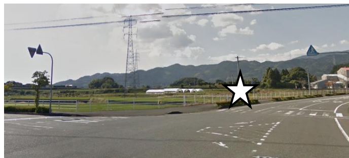
③ 引地東 (旧県道入口)