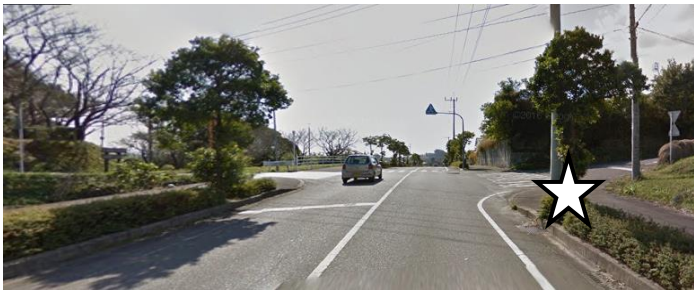
① オの上 (穂の家西下)