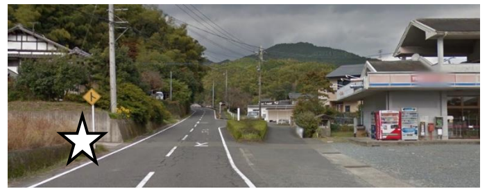
⑦仁蓮寺 (RIC 付近)