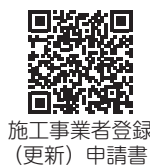
施工業者登録（更新）申請書

鳥栖地区広域市町村圏組合では、介護保険に基づく住宅改修を行う場合、住宅改修施工業者の登録を必要としています。登録を希望する事業者は、登録申請をお願いいたします。なお、今回登録申請をされなかった場合、令和9年7月まで登録できませんのでご注意ください。申請期間は令和8年5月1日（金）～5月29日（金）です。