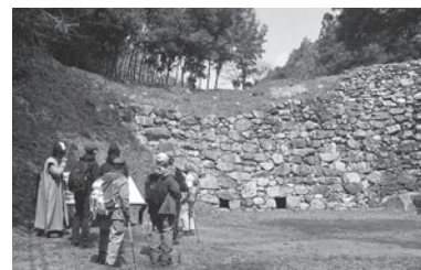
◀ 昨年のハイキングのようす