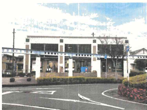
JRけやき台駅前「きやの里/基山SGK交流プラザ」

この度、特定非営利活動法人(NPO法人)きやまSGKは、地元の団体・サークル等と協力し、イベント「(第4回)食の祭典と歴史さんぽ」を開催することになりました。JRけやき台駅管理業務等も受託4年目を迎え、今後も本業務を通じて、さらなる地域活性化に取り組んでいきます。