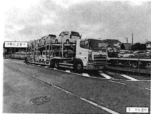
写真-2 トレーラー全景