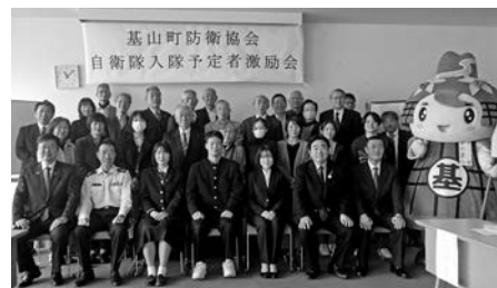
入隊予定者は、前列中央の3名です

基山町防衛協会への入会を希望される方は、総務課防災係（☎92-7915）まで、ご連絡ください。