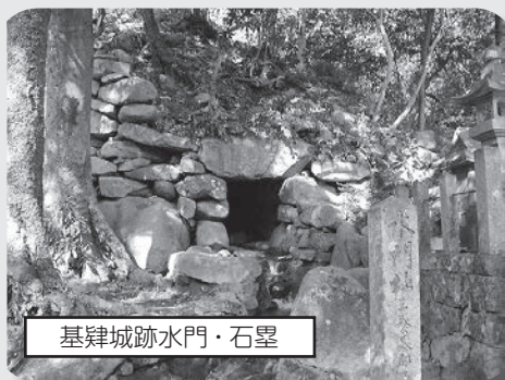
基肄城跡水門・石塁