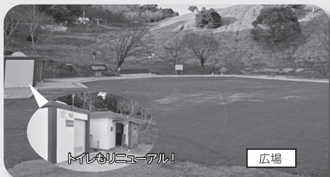
トイレリニューアル！