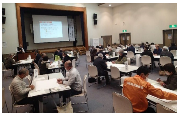
(昨年度の研修会の様子)

自主防災組織とは、災害対策基本法に基づき、地域住民が自主的、自発的に防災活動を行う組織で、基山町では 17 の行政区全てで自主防災会として結成されています。各自主防災会のリーダー等を対象に、自主防災組織リーダー研修会を実施します。