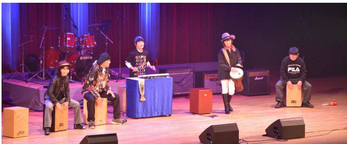
(昨年度の「アイが大きい基山町音楽祭」の様子)

音楽を通じて、地域住民の交流を深め、文化振興を図るために基山町主催事業「アイが大きい基山町音楽祭」を開催します。町民や町内で活動する団体・グループによる演奏を披露していただきます。