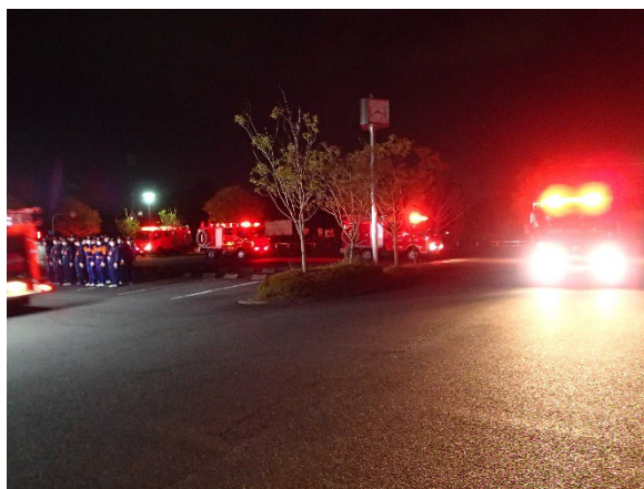
(昨年度の出発式の様子)

基山町消防団では、この時期に合わせ、就寝前に火の元を再度確認していただくことやストーブの近くに燃えやすいものを置かないなど、火の用心に関する広報活動をするとともに、夜間巡回と消防格納庫に待機して火災の発生に備えます。今年の年末警戒出発式は次のとおり行います。