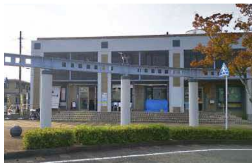
JRけやき台駅前「きやの里/基山SGK交流プラザ」

この度、特定非営利活動法人(NPO法人)きやまSGKは、地元の団体・サークル等と協力し、イベント「食の祭典と歴史散歩」を開催することになりました。JRけやき台駅管理業務も受託2年目を迎え、今後も本業務を通じて、更なる地域活性化に取り組んでいきます。