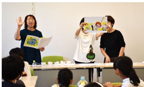
（まあまぼけっとさんの読み聞かせの様子）

また、おはなしの後は、「牛乳パックおうちペンスタンド」手作りワークショップを行います。図書館で、ちょっぴり早いクリスマスを楽しみませんか。