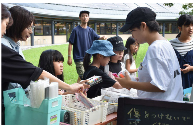
（過去のおゆずり会の様子）

CLEANs は、このイベントを最後に2021年から続けてきた活動を休止することです。今までたくさんのご協力に感謝し、ラストイベントは、文房具のおゆずり会やリメイク、フォトラリーなど、盛りだくさんの内容となっています。