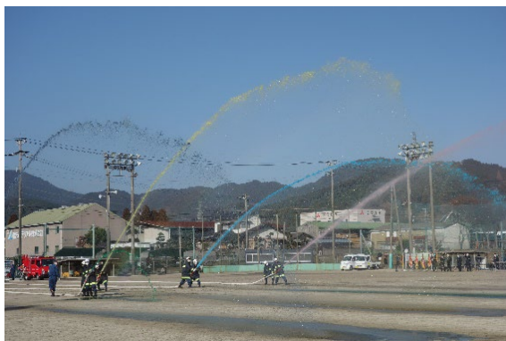
（昨年度の五色放水の様子）