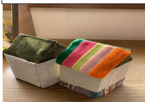
ワークショップ「牛乳パックおうちペンスタンド」