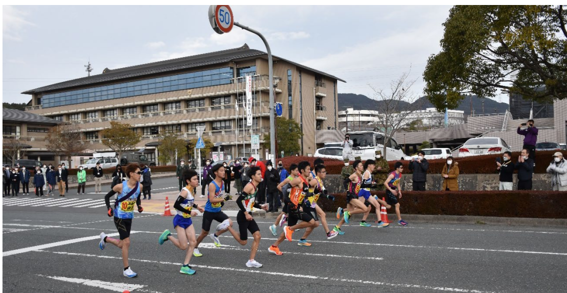
(昨年度の県内一周駅伝の様子)

令和6年2月16日（金）～18日（日）に、佐賀新聞社主催の郡市対抗県内一周駅伝大会が開催されます。本大会は2月16日に基山町役場前をスタートし、同18日の佐賀新聞社前のゴールまで全33区間、272.9kmで頂点を競います。