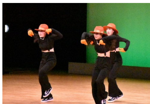
（昨年度のダンスフェスティバルの様子）