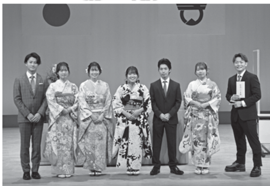
実行委員の皆さま 事前準備から当日までお疲れ様でした！