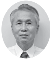
7区 境 知生