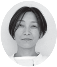
4区 調 三鈴