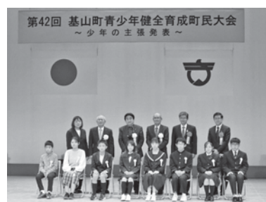
少年の主張発表者8名

主張発表及びアトラクションは、基山町ホームページから動画をご覧いただくことができます(令和4年12月31日まで)。