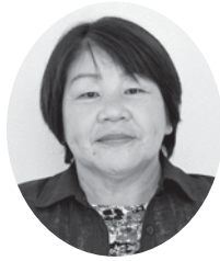
2区 原 末代