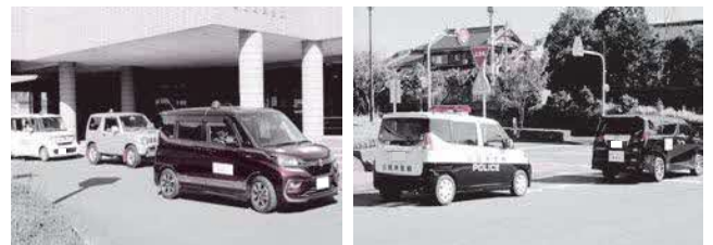
合同パトロールの様子