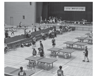
▲卓球も開催されました!