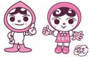
人権イメージキャラクター 人KENももる君・人KENあゆみちゃん