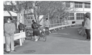
△「おはようございます! 私達「こども見守り隊」です。」

県内の人身交通事故は、通勤通学の時間帯(午前6時~9時台・午後4時~7時台)に多く発生しており、全事故の5割以上を占めている状況です。みなさんのこのような見守り活動は、事故を未然に防ぐ大きな力となり、地域の安心や安全に繋がります。ありがとうございます。