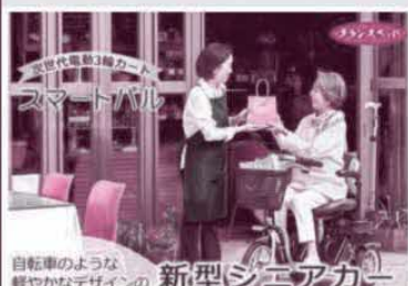
自転車のような軽やかなデザインの新型シニアカー