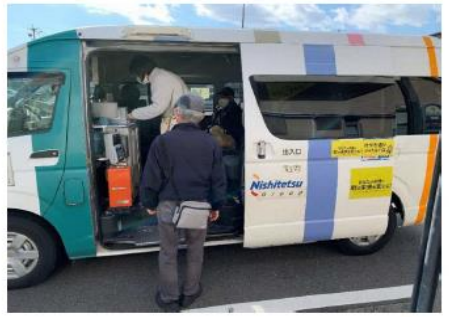
オンデマンド交通