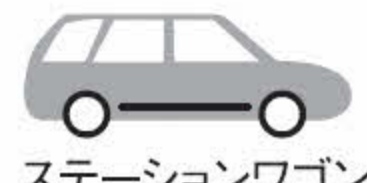
ステーションワゴン