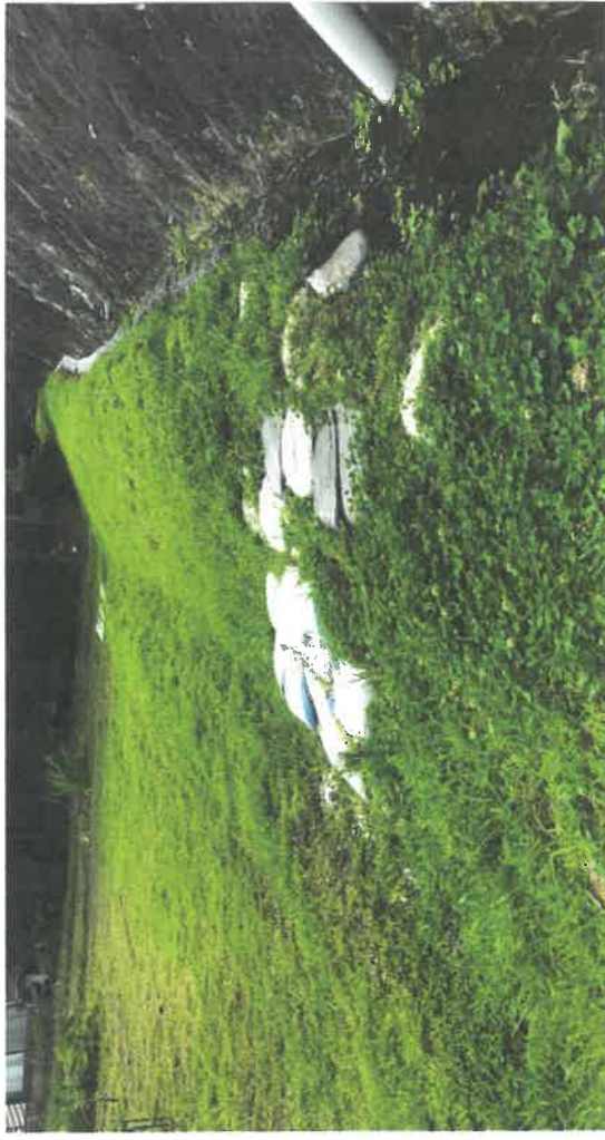
同左写真の土手を近くで見たところ。