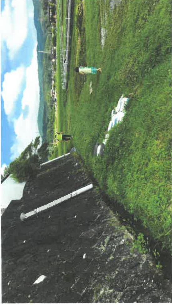
農用水路の土手が崩れ、土のう袋で土手を補強している。