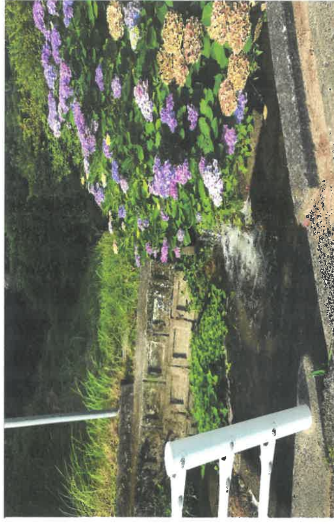
現在は、この農用水はA地点から先は水田利用はなく、基山中学校との境で4区学童通路に沿って流れている農用水路に流れ込んでいる。