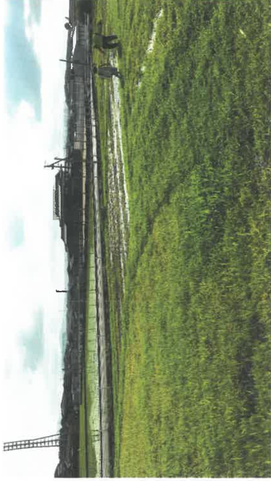
農用水路からの漏水で畑が水浸しになっている。