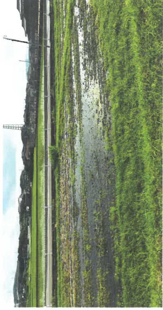
写真上部は4区学童通路と農用水路。畑が農用水路からの漏水で常時水が溜まっており、作物が作れない。