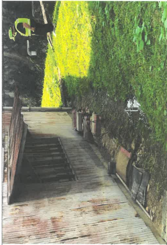
宅地の農用倉庫裏にも漏水により、「水が溜まっている。大雨時は倉庫内まで浸水する。