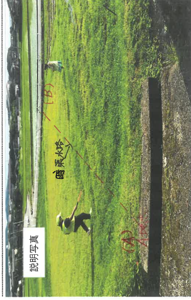
写真上は4区学董通学路で通学路に沿って約2メートル幅の農用水路が流れている。A地点からB地点の農用水路に暗渠で分水する。