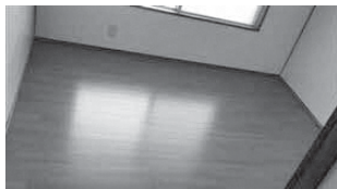
和室1部屋→洋室へ変更