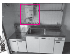
キッチン 湯沸器の設置