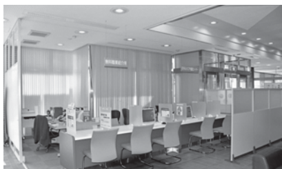
△役場1階正面玄関横に移設

基山町役場1階の福祉課と住民課の間にあった基山町無料職業紹介所を令和3年1月から同じく役場1階正面玄関横に移設し、リニューアルオープンしました。移設に伴って、いままでの窓口に加えてミドルシニア相談窓口を新たに設けましたので、働きたいと考えられているミドルシニア世代の方は、ぜひ、ご利用ください。