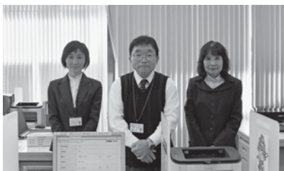
△無料職業紹介所職員