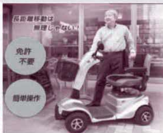
電動カート購入費援助商品