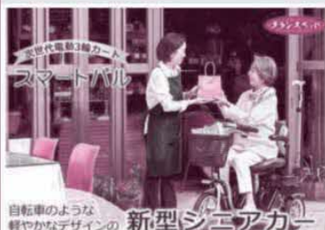
自転車のような軽やかなデザインの新型シニアカー

お客様のご自宅周辺で『無料お試し試乗会』を実施しております お気軽にお問合せください フランスベッド販売(株) 鳥栖市東町2丁目896-4 ☎0942-87-7780