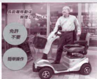
電動カート購入費補助商品