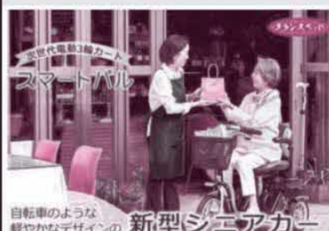
自転車のような軽やかなデザインの新型シニアカー 電動カート購入費補助商品