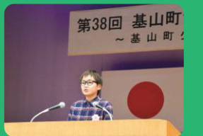
基山町少年の主張発表会

年2回、町内の小学生なら誰でも参加できるイベントを企画。夏休み期間中の自然体験合宿や社会見学、子どもたちによる主張発表会などが開かれています。