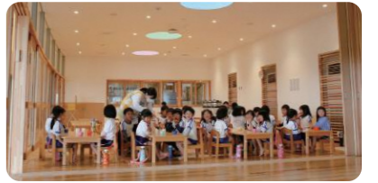
木のぬくもりを感じる保育室やランチスペース