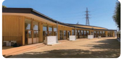
保育士の目が行き届く園庭は安全安心です