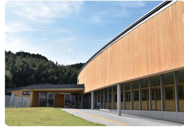
町の豊かな自然を身近に感じる園舎は一階建て