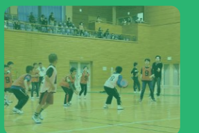
区対抗のドッチビー大会も

希望する小学生と中学生が各区で所属して、地域イベントを通して交流を深めます。町民体育大会や区対抗のスポーツイベントは毎年、熱戦!