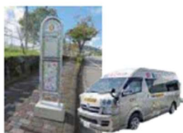
コミュニティバス 通学全額補助