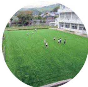
中庭が人工芝になりました!