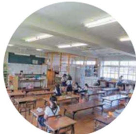
放課後児童クラブも 余裕があります!