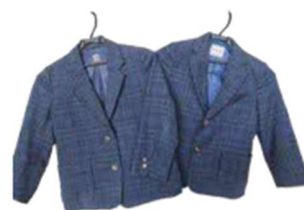
制服購入費全額補助