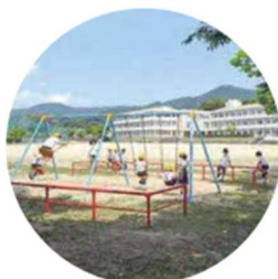
運動場も広々使えます