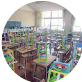
各学年教室+学習室で 活動がスムーズ