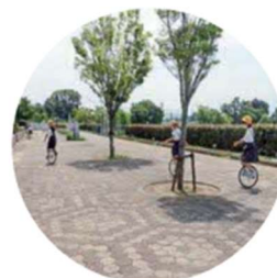
一輪車も人気です!