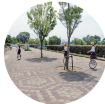
一輪車も人気です！