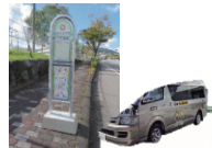
コミュニティバス 通学全額補助