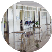
静かな環境で学習できます