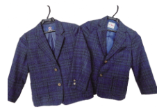
制服購入費全額補助