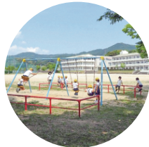
運動場も広々使えます