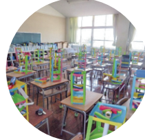
各学年教室+学習室で活動がスムーズ