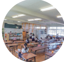
放課後児童クラブも余裕があります！