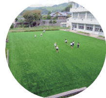
中庭が人工芝になりました！