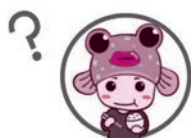
さが食育キャラクター たべんぱくん