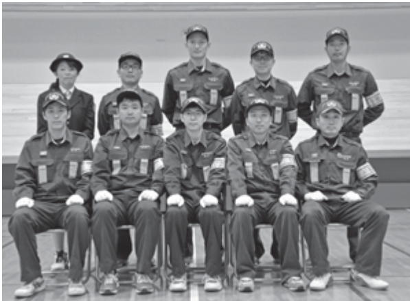
上段左から 女性部長、9部長、8部長、7部長、5部長 下段左から 4部長、3部長、2部長、1部長、本部長