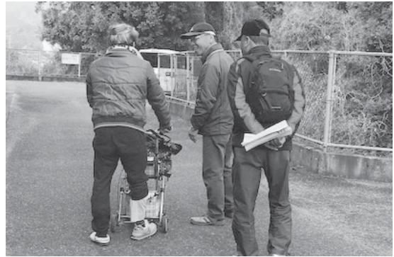
問合せ先 福祉課 高齢福祉係 ☎92-7964

町では、認知症になっても安心して暮らせるまちづくりの取組みの一環として、徘徊した認知症高齢者を発見し声をかける「認知症声かけ訓練」を実施しています。平成27年は第7区、平成28年はけやき台地区、平成29年は第9区、平成30年は第6区・第10区で開催し、今後も引き続き各区で開催していきたいと考えています。