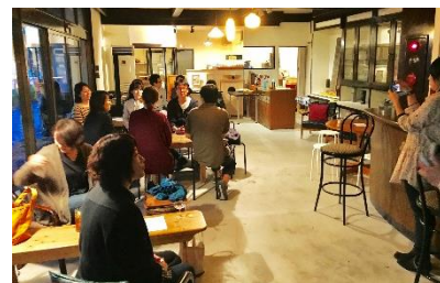
空き店舗活用チャレンジショップ事業