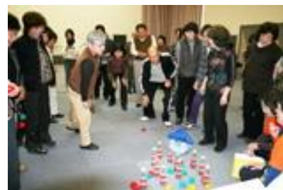
基山スマートウェルネス事業