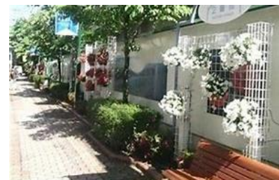
商店街への通り抜け道路事業