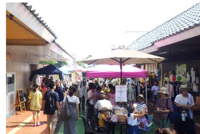
モール商店街にぎわいづくり事業