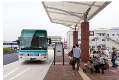
基山駅前ロータリー整備事業