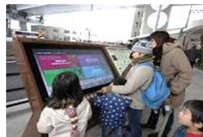
街なみ案内サイン事業