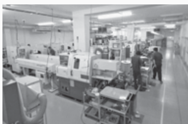
△自動供給装置を配して、無人化 24 時間稼働を推進しています

当社の何よりの魅力は、縦と横の繋がりが良い点です。業務においても些細な提案や業務改善をやすく、部署全体で「より良い職場にしよう！」という雰囲気が強いと思います。また、製作において、精度の高い加工が多く、難しい加工ができたときの喜びのために、頑張れる会社です。