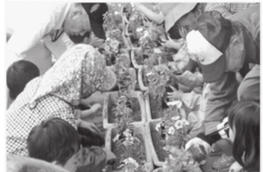
問合せ先 基山町老人クラブ連合会 占野 ☎92-3704

6月5日(火)、基山保育園で園児たちと一緒にプランターへの花苗(日々草・ポチュラカ)の植え替えを行いました。朝からあいにくの小雨でしたが、園児たちは笑顔いっぱい楽しんでいました。