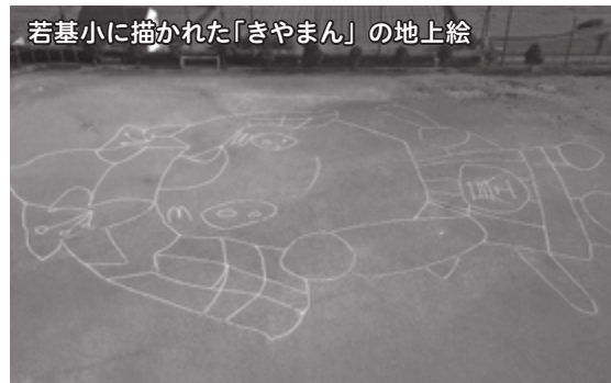
若基小に描かれた「きやまん」の地上絵