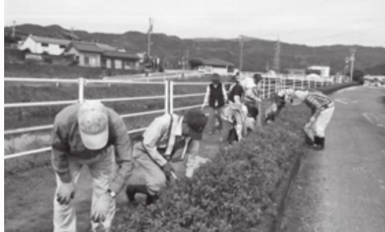
問合せ先 基山町老人クラブ連合会 占野 ☎92-3704

6月14日(木)に1・11区、17日(日)に5・9区で秋光川の花壇清掃が実施され、各区の役員や会員の方々によってきれいになりました。