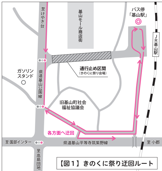
【図1】きのくに祭り迂回ルート

※臨時便（1号車午後7時以降の便及び2号車午後6時以降の便）では、きやまんきっぷ及びげんきっぷは使用できません。 ※きのくに祭りが中止になった場合は、通常どおり運行します。