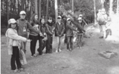
▼対馬市の方々と集合写真