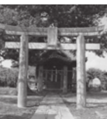
八幡神社(北奈良田)

ごみの減量や分別の大切さを理解していただくことを目的にクリーンヒル宝満(ごみ処理場)の見学会を開催します。 この施設の特徴は、ごみを燃やすのではなく、高温で溶かして処理することです。メリットとして、