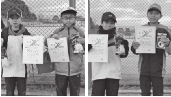
問合せ先 基山ジュニアソフトテニス 平野 ☎92-2721