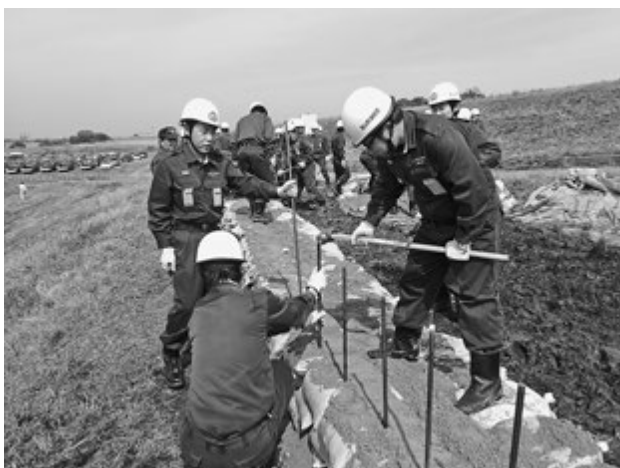
▲土のう積工法の様子

住民への情報伝達、土砂災害危険区域の住民避難行動、避難所開設等の訓練が行われました。今回は第2区地域で土砂災害が発生する危険が生じ、避難勧告が発令されたとの想定の下、防災行政無線、緊急速報メール(エリアメール)、そして基山町ホームページによる情報伝達を行い、第2区地域住民の方々に町民会館へ実際に避難をしていただきました。