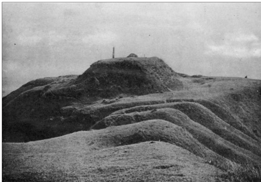
主郭と畝状豎堀群 (通称 いものがんぎ)