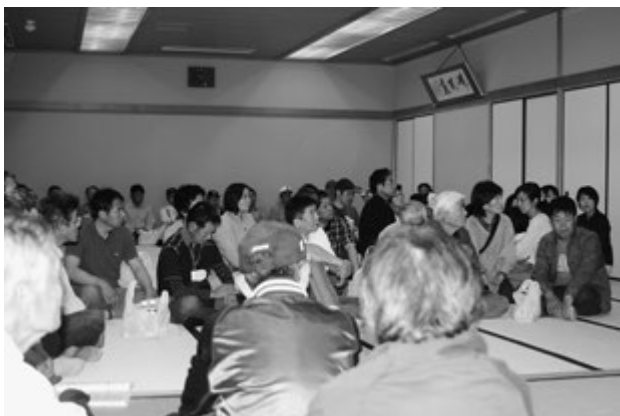
▲避難所に待機されている様子

住民への情報伝達、土砂災害危険区域の住民避難行動、避難所開設等の訓練が行われました。今回は第2区地域で土砂災害が発生する危険が生じ、避難勧告が発令されたとの想定の下、防災行政無線、緊急速報メール(エリアメール)、そして基山町ホームページによる情報伝達を行い、第2区地域住民の方々に町民会館へ実際に避難をしていただきました。