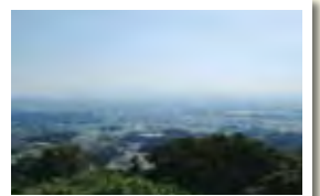
基山山頂からの眺望