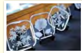
すなほりからす対翠社