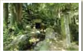
基肄城(きいじょう)水門跡