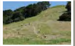
基山山頂草スキー場