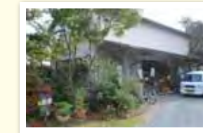
酒プティック丸久