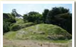
基肄城跡いものがんぎ