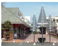
基山モール商店街