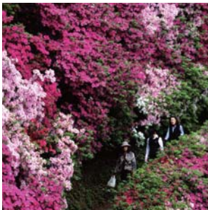
4月中旬～5月上旬:大興善寺つつし祭り