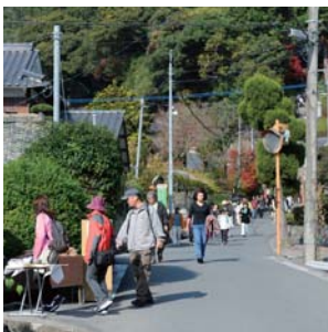
11月下旬:秋のJR九州ウォーキング