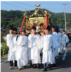
10月17日に近い日曜日:園部くんち