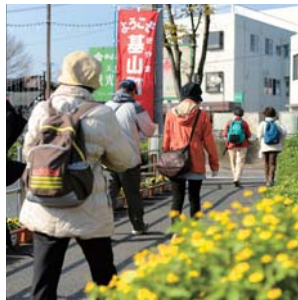
4月下旬:春のJR九州ウォーキング