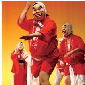
11月1日～3日:基山町文化祭