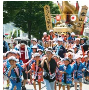
7月下旬:きのくに祭り