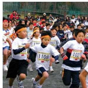
12月第1日曜日:きやまロードレース大会