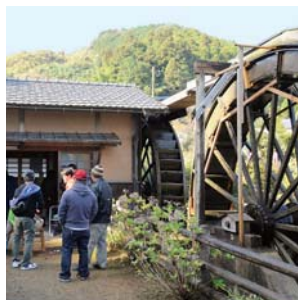
11月下旬:水車まつり