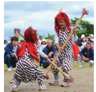
9月秋分の日:御神幸祭