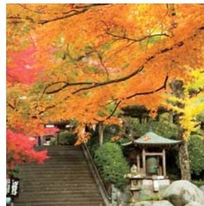
11月中旬～12月上旬:大興善寺もみじ祭り