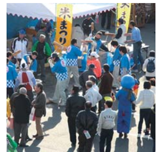
12月第2日曜日:ふ・れ・あ・いフェスタ