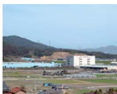
基山グリーンパーク

町内には交通の利便性を活かして、基山工業団地や基山グリーンパーク等の工業団地が整備され、製造業、流通業を中心にたくさんの企業の工場や事務所が立地しています。