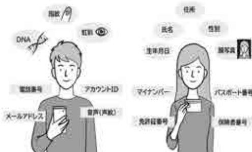
マイナンバーや免許証も個人情報