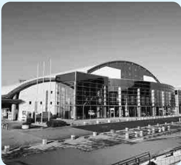
会場となる総合体育館

基山町では、卓球、パワーリフティング、草スキーの競技が予定されており、受け入れ施設では日々準備が進められている。 今回は、リハール大会をはじめ、本大会までの基本的スケジュール、受け入れ体制の進捗状況等について現地調査を行った。 当委員会としては、本町の良さをアピールする絶好の機会であるため、誠意をもって来訪者を迎える体制を整えるよう提案した。