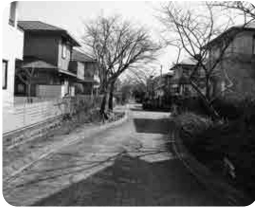
けやき台の住宅街