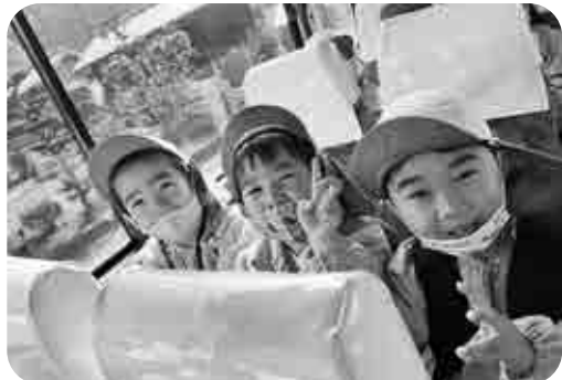
バスの安全確保は十分に

家庭的保育事業者等 への安全計画の策定 及び周知、職員および訓練実 施の義務化や自動車を運行 する場合の点呼、その他確実 な把握方法による乳幼児の 所在の確認を義務化するこ とになった。