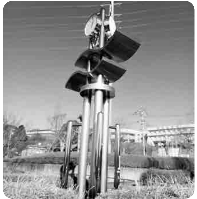
総合公園の時計台