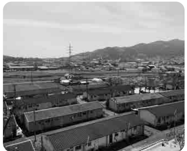
園部団地の建て替え