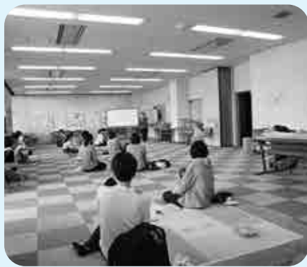
乳幼児健診の様子

希望者のみを対象としているため、現在の人員及び会計年度任用職員で対応していく。 当委員会としては、関係機関等と連携し、支援事業の効果を高め周知と利用促進に努めるよう提案した。