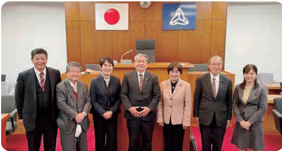
研修先・高知県越知町の本会議場にて

改選により委員会のメンバーは変わりますが、これまで2年間ありがとうございました。 (広報編集委員会 一同)