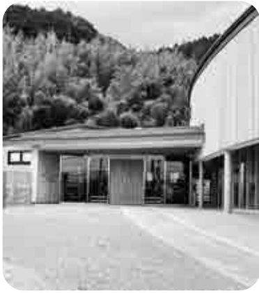
基山保育園も就労証明見直し

問 令和5年4月受付から、子どもの父母と65歳未満の祖父母のみの提出に見直しをする。