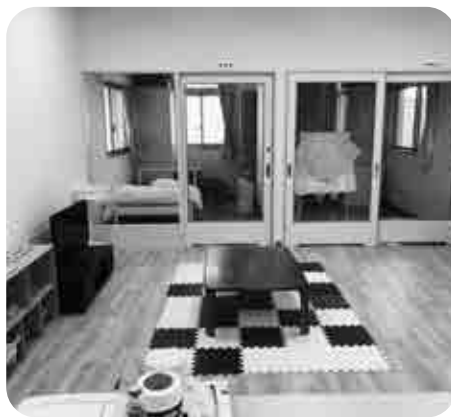
病後児保育施設内の様子