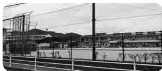
校舎が増築される基山小学校