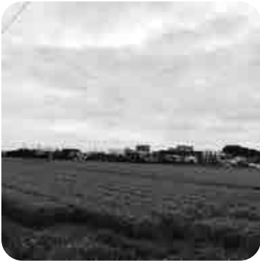
流通業務施設の開発計画が進められている長野の島廻地区