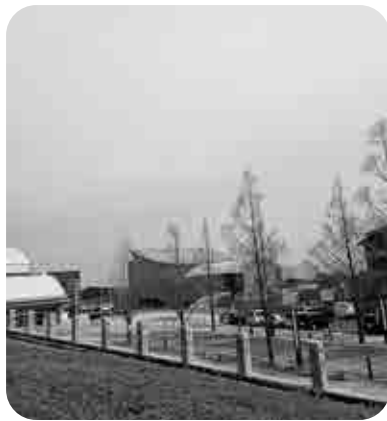
役場周辺に常設物販店舗を

答 ある程度集客が見込める催しには臨時売店に対応。基山の特産品をPRできる場を拡大したい。