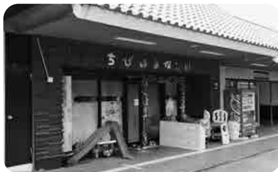
ちびはる保育園の一部が夜水地区へ移転