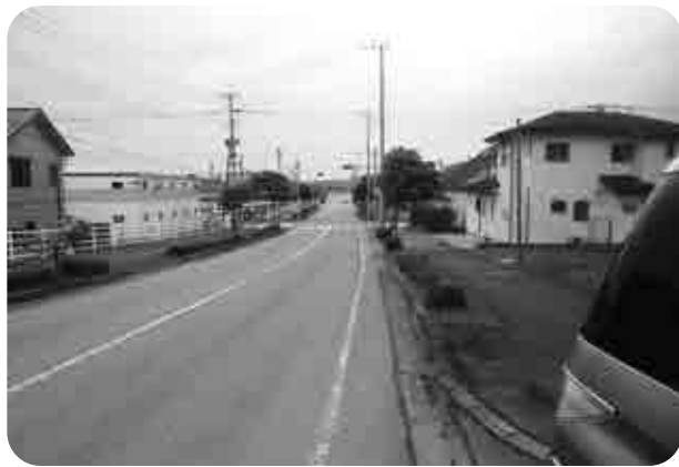
延伸が待たれる塚原・長谷川線