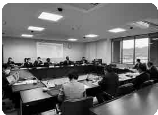
三豊市議会での研修の様子

当委員会も、研修で学んだ紙面の編集や分かりやすい内容、視覚的な誌面づくりに努め、さらに全面的なカラー化も提案したい。