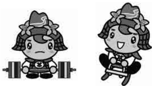
基山町の競技種目「卓球」・「パワーリフティング」・「草スキー」

答 国スポは令和6年9月にパワーリフティングと草スキー、10月に卓球、全障スポも同月に卓球と卓球バレーを本町で開催する。