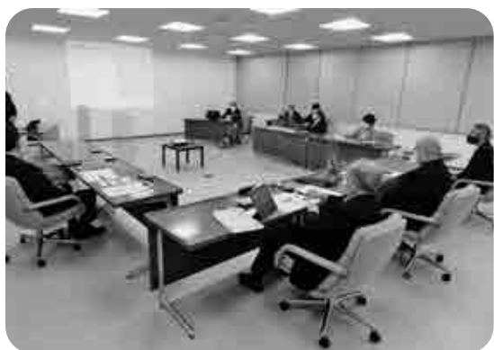
中津市議会での研修の様子

による持ち回りで2～3のテーマに基づき行い、議会運営委員会で議決するか決定される。