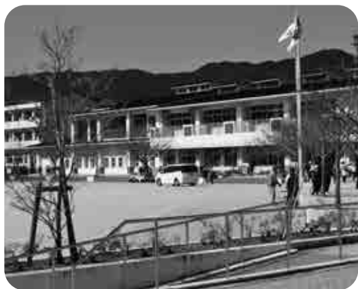
基山小校舎増築はどこに？

問 いろいろな事情で学校に行けない子の手立てとして、教育支援センター「まいるーむ」が開設された。その経過と見直しはどうか。 答 町が支援員一人を配置して運営している。指導主事2人もバックアップしている。通う子が多くなれば、さらに検討する。