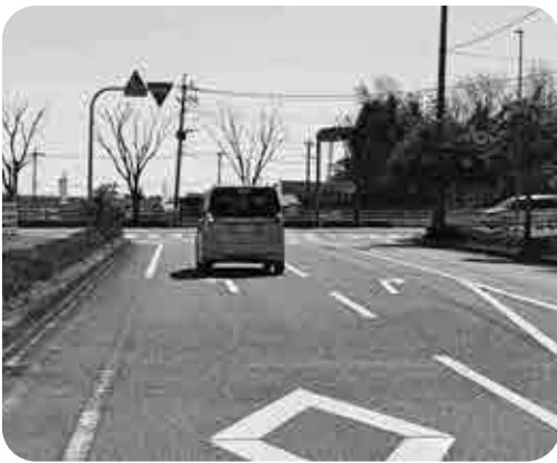
弥生が丘までつなく延伸を

問 昨年11月の行政視察で訪れた福井県の一乗谷朝倉氏遺跡を見学したが、以前は資料館としてあった施設が県事業で博物館となり、多くの観光客で賑わっていた。基山町も基肄城跡保存整備計画を佐賀県に全権移管してはどうか。 答 県に対しては予算面・人的協力をお願いしている。その中で事業の移管を何回も話しているが了解してもらえない。