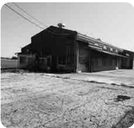
廃止になる長野共同乾燥施設

答 まずはハラスメントが起きない環境を作る。条例制定についてはまだ考えていない。