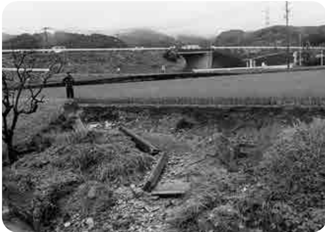
農地農業用施設災害復旧工事

農地農業用施設災害復旧費分担金が国の連年災害の認定を受け、補助率が増高の適用を受けたことによる受益者負担金の減