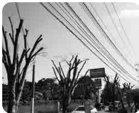
樹木に負担をかけない剪定を (秋光・久保田線 マックスバリュ付近)