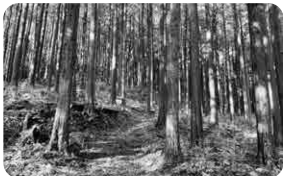
手入れが行き届いたひのき林

提案 今回、計画変更につい て対象者や議会への説明が なく、当初予算の計画どおり 履行されなかったことは問 題である。 今後の計画内容及び事業 実施時期について明確に提 示し、早急に事業に着手す ること。