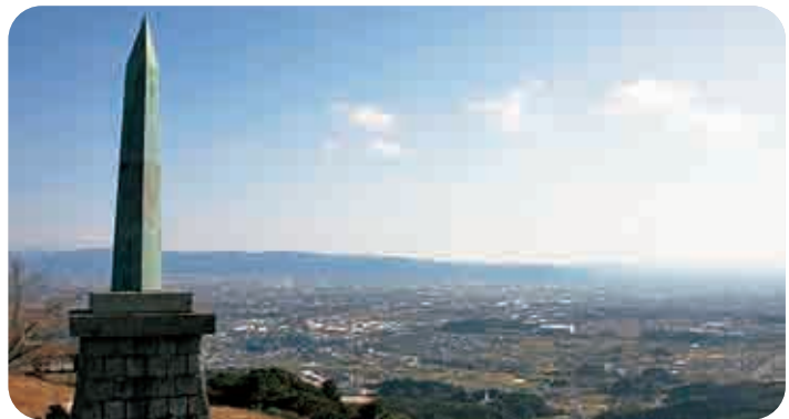
筑紫平野を一望できる 基肄城跡

今回から、私たちにとって心のふるさととも言える 基肄城 を表題として選びました。この議会だよりが町民の皆様にも末永くご愛読されることを願っております。