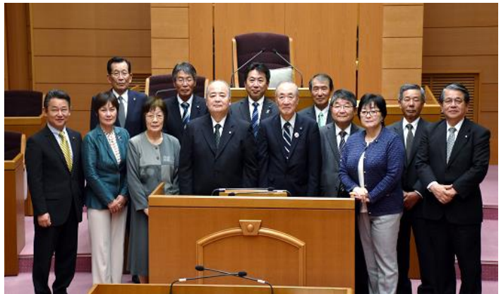
町民に開かれた議会をめざして