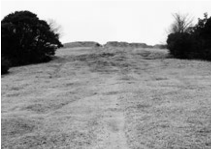
写真1 草スキー場から上を望む (中央に見える高まりが土塁)