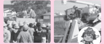
基山のイメージキャラクター 【きやまん】