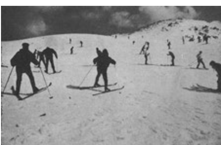
写真3 かつての冬スキーの風景