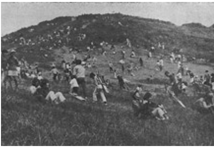
写真2 かつての草スキーの風景 (昭和46年刊行『基山町史』より一部改変・転載)

います。現在、スキー場の天然草を保護するために、プラスチックスキー板の使用は禁止されています。そのため、シーズン中は木製スキー板の貸出しが行われており、1台300円で借りることができます。土・日曜日、祝日は、基山公園駐車場から上がった左手にある小屋で貸出しが行われており、山頂へ続く丘陵や傾斜面が滑る場所になります。ちなみに、スキー場