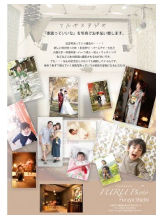
家族写真撮影チケット