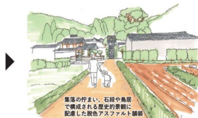
参道の美装化イメージ