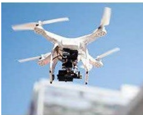
ドローンスクール受講チケット