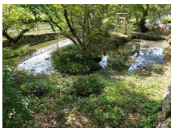
← 工 事 前