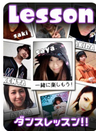
ダンスレッスンチケット