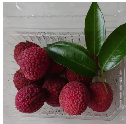
収穫されるライチ（イメージ）