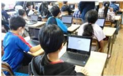
学校で端末を使用している児童の様子